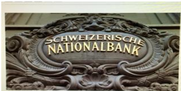
Die SNB kann nicht glänzen.

15.01. La Banque nationale suisse supprime le taux plancher de CHF 1,20 pour un Euro, introduit en septembre 2011. L'abandon du cours minimum de l'Euro surprend tout le monde. Les variations de cours qu'il entraîne soumettent l'industrie suisse d'exportation à un choc douloureux et la BNS elle-même doit enregistrer des pertes comptables par milliards. Economiesuisse compte déjà avec des milliers de pertes de postes de travail. Cette faïtière déclare que le processus de délocalisation de postes à l'étranger n'en est qu'à son début. En 2016 aussi, de nombreux postes seront supprimés à cause du franc fort. La Banque nationale du Danemark, qui se trouve dans une situation semblable, a pu maintenir le cours de change